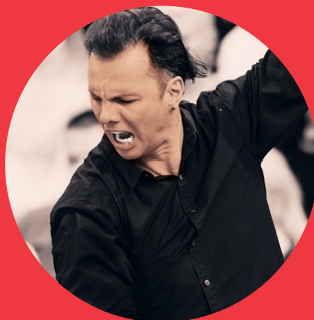
rèquiem de mozart