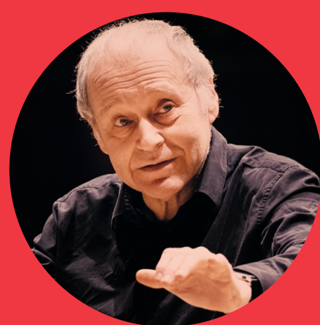
cinequena de mahler