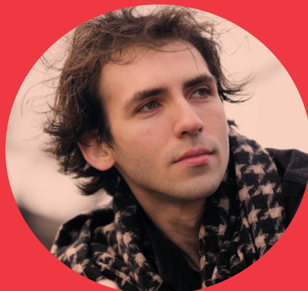
romeu i julieta