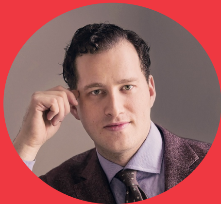
novena de beethoven